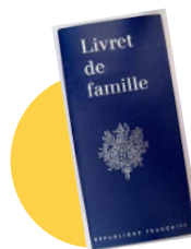
● Le livret de famille (en cas de prise en charge d'une personne mineure dont vous êtes le représentant légal)