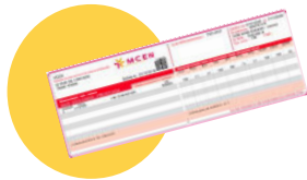
● Carte de mutuelle