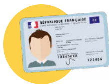
● Pièce d'identité