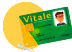
● Carte vitale